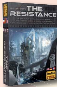
THE RESISTANCE de Don Eskridge