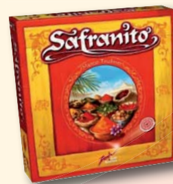
SAFRANITO de Marco Teubner