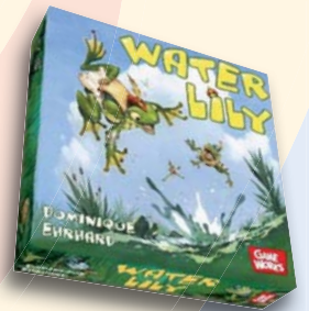
WATER LILY de Dominique Ehrhard

Le LABEL LUDO est une initiative de Ludo asbl, organisée en partenariat avec les Ludothèques de la Communauté Française et le soutien du Secteur Ludothèques de la Cocof, Yapaka et la Communauté Française de Belgique.