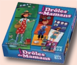
DRÔLES DE MAMANS de Dominique Ehrhard